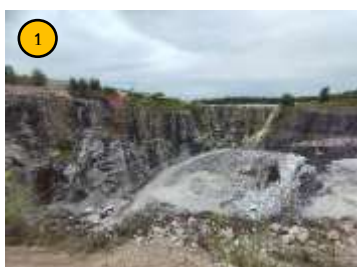
พื้นที่หน้าเหมือง