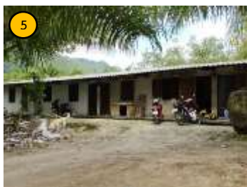
บ้านพักพนักงาน