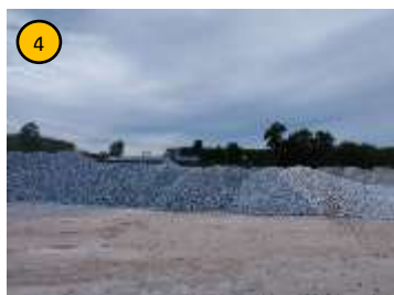
ลานเก็บกองแร่