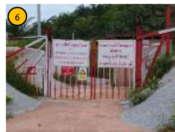
อาคารเก็บวัสดุระเบิด