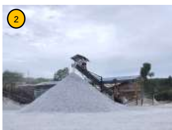
โรงแต่งแร่ของโครงการ