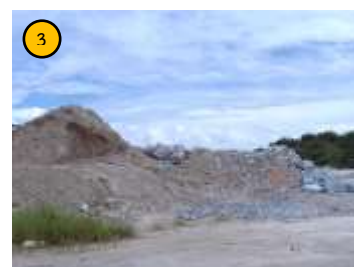
กองเปลือกดิน